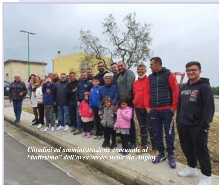
Cittadini ed amministrazione comunale al "battesimo" dell'area verde, nella via Angioy