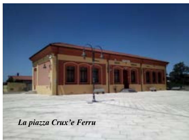
La piazza Crux'e Ferru