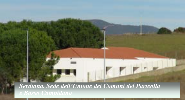
Serdiana. Sede dell'Unione dei Comuni del Parteoolla e Basso Campidano