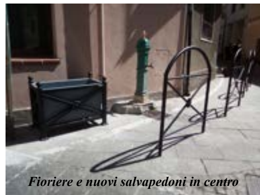
Fioriere e nuovi salvapedoni in centro