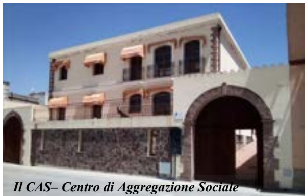
Il CAS - Centro di Aggregazione Sociale

Finalmente si inizia a respirare aria di "normalità", dopo due anni di chiusure per pandemia. Ricominciano diversi servizi che erano stati sospesi. Ed è ricchissimo il programma proposto all'interno del Centro di aggregazione sociale che ospita l'animazione estiva a partire dal 14 giugno, tutti i giorni dal lunedì al venerdì, per la fascia primaria e dal 1 luglio, anche per l'infanzia dal lunedì al venerdì, dalle 8.30 alle 13.30, fino al 29 luglio. Spiaggia Day. E torna anche il servizio Spiaggia Day, dal primo luglio, e fino al 29 luglio, che porterà i giovani bagnanti alla spiaggia Poetto di Cagliari, per le fasce d'età 6-10 anni e 11-14 anni, il lunedì, mercoledì e venerdì, dalle 8.30 alle 13.30. Il programma di animazione, messo a