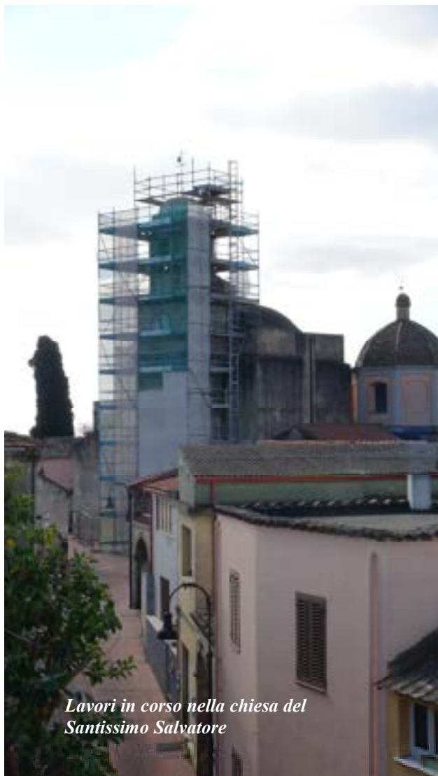
Lavori in corso nella chiesa del Santissimo Salvatore

C'è anche un centro servizi nella nuova piazza Crux'e Ferru, insieme all'area verde, nuove sedute e non solo.