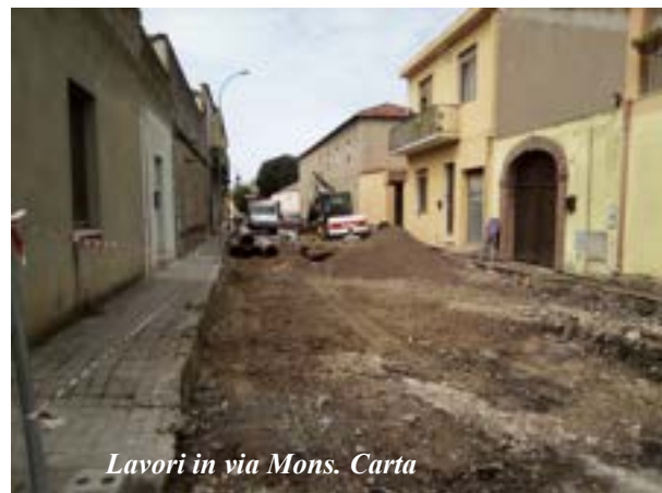
Lavori in via Mons. Carta